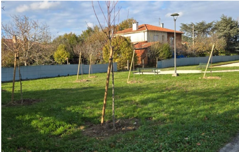
Angle Taparot/Îles Célèbre, 10 cerisiers à fleurs et érables