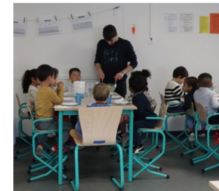
Rénovation du réfectoire de l'école Henri Puis

En parallèle de ces projets plus conséquents, de nombreux « petits travaux » sont menés : ajustements électriques, pose de tampons en caoutchouc sous