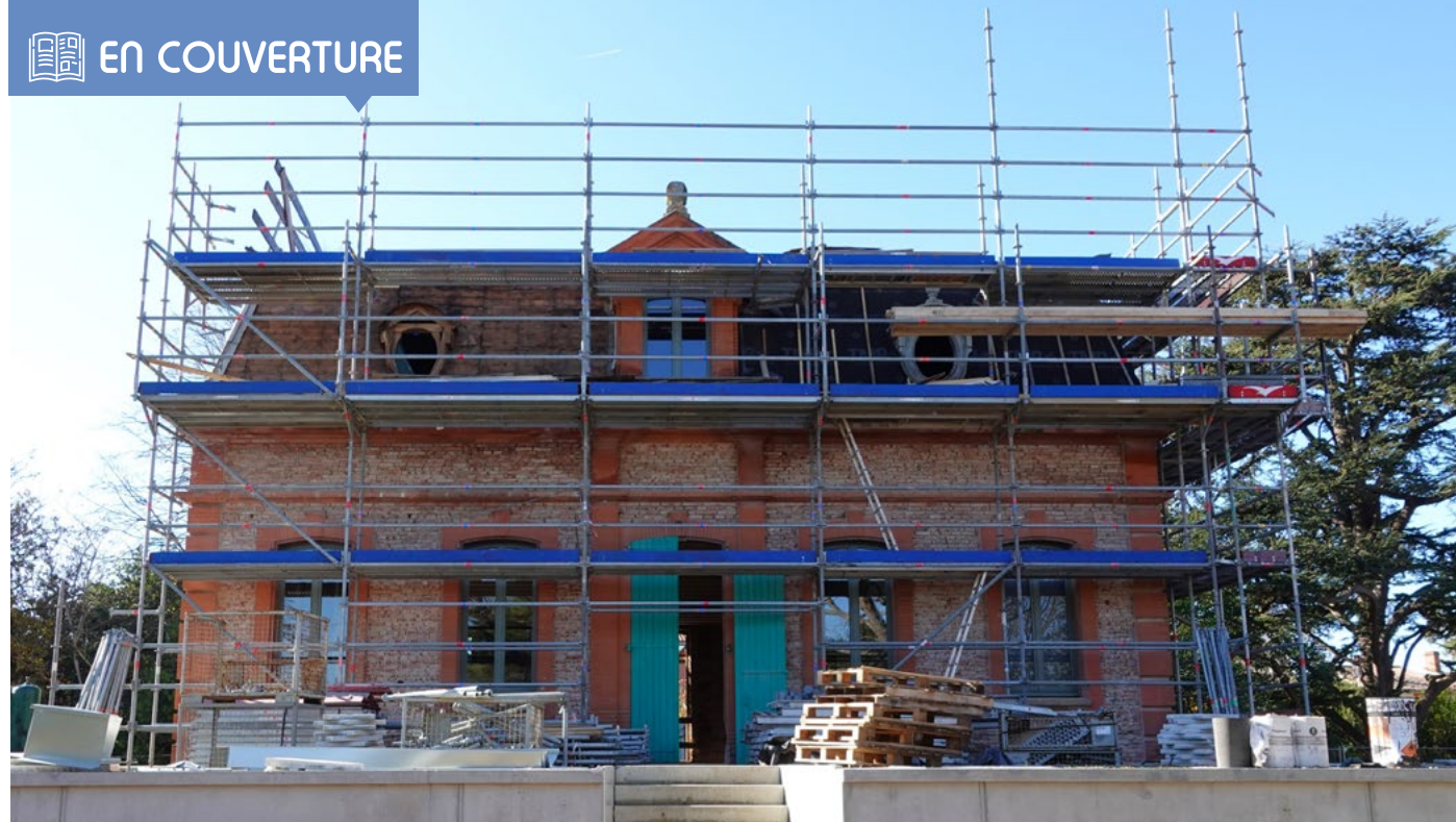
Vue arrière de la Villa