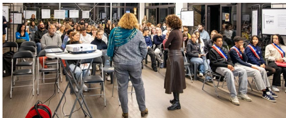
Soirée de lutte contre le harcèlement scolaire

sensible qui met des mots et des images sur ce que vivent les jeunes. Le collège Jacques Prévert a, lui, diffusé un court-métrage et un documentaire (primé) donnant la parole aux ambassadeurs du dispositif PHARE, engagés pour un collège plus serein et bienveillant. Une fresque a également été réalisée avec l'ensemble des classes de 5 e .