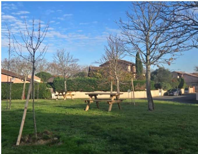
Rond-point de l'Orée du bois, 7 érables