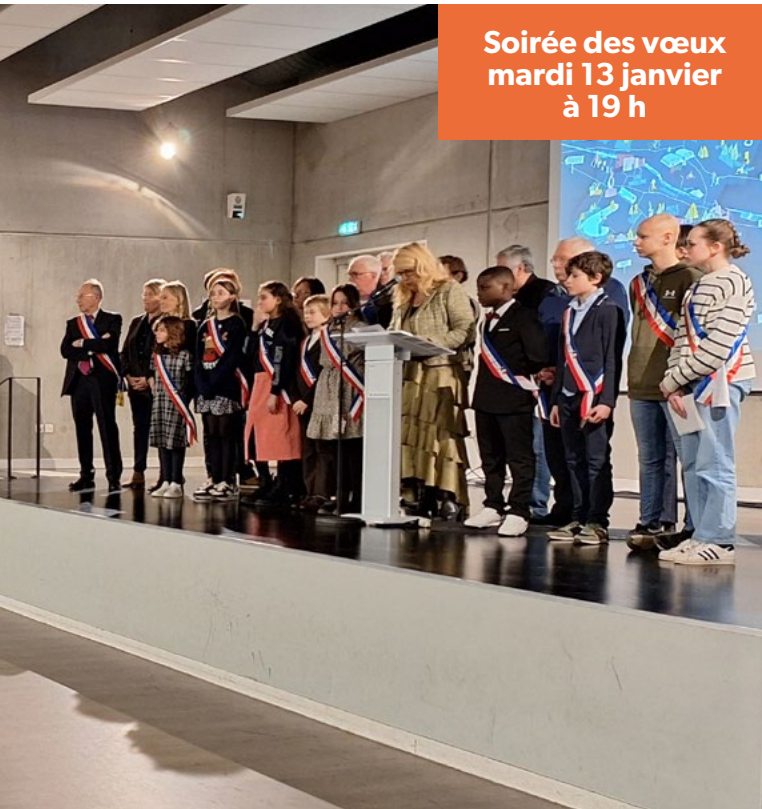
Soirée des vœux mardi 13 janvier à 19 h