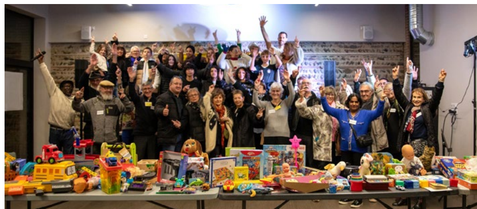
Soirée du Téléthon

La jeunesse ne manque ni d'idées ni d'énergie pour défendre. Plusieurs initiatives ont prouvé que nos jeunes savent s'engager, créer et rassembler autour de valeurs fortes !