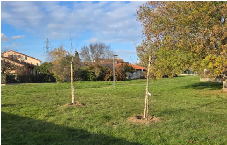
Coulée verte rue des Seychelles, 2 liquidambars

Samedi 17 janvier : Venez découvrir la boucle du pic épeiche à travers une balade nature