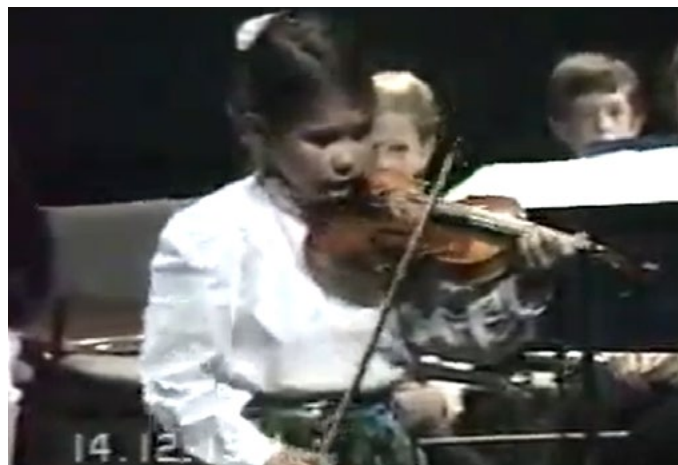
Son premier spectacle à Altigone en 1991

“ Le moment sur scène, c'est le partage avec le public et l'aboutissement du travail. J'ai toujours voulu garder du naturel et de l'authenticité dans ma façon d'interpréter les œuvres. ”