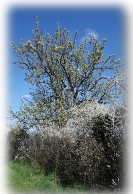
Poirier sauvage Rue de Nazan

Un arbre peut être remarquable par sa hauteur, son âge, son histoire, sa rareté, ... Il est important de le conserver et de le protéger , du fait de ses nombreux rôles dans la ville.