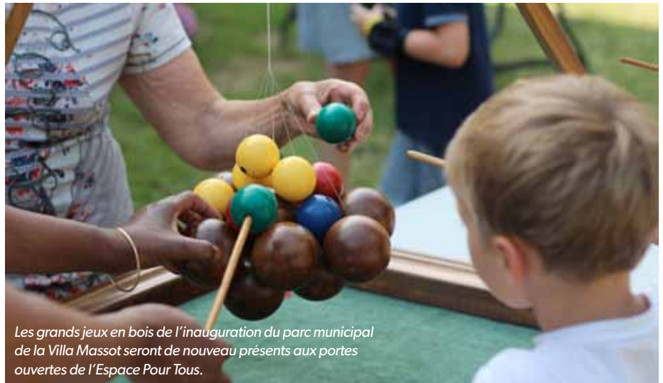
Les grands jeux en bois de l'inauguration du parc municipal de la Villa Massot seront de nouveau présents aux portes ouvertes de l'Espace Pour Tous.

L'Espace Pour Tous est un équipement municipal à vocation familiale et intergénérationnelle agréé par la Caisse d'Allocations Familiales de la Haute-Garonne. Chacun peut y trouver sa place : enfants, parents, jeunes, seniors.