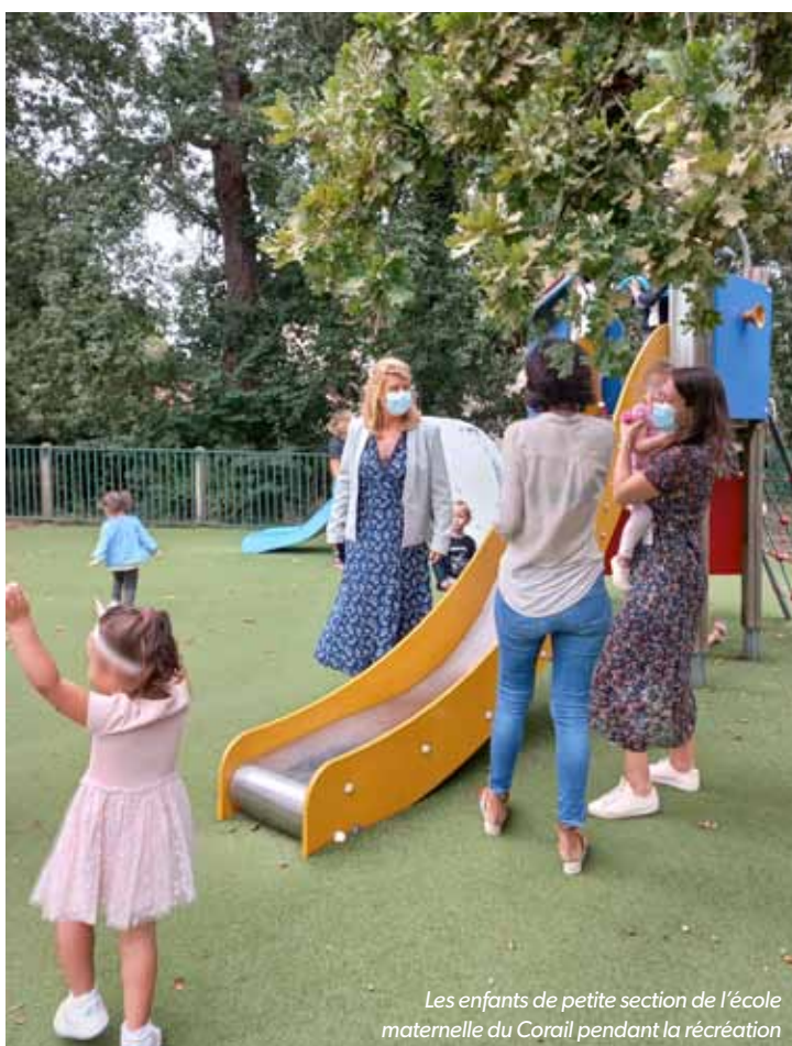
Les enfants de petite section de l'école maternelle du Corail pendant la récréation