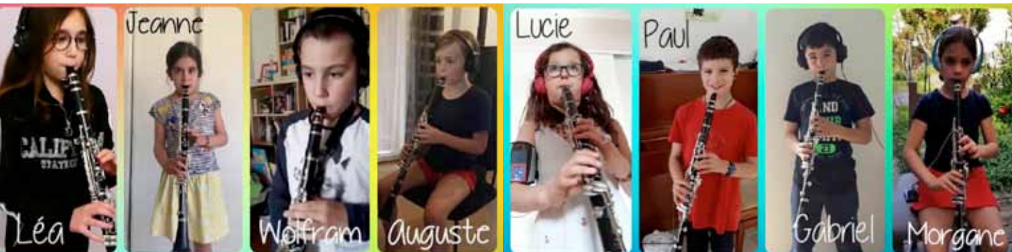
Cours de clarinette en visio.

La réouverture de l'école est confirmée. Un soulagement pour toute l'équipe qui retire de cette expérience difficile des enseignements très positifs.