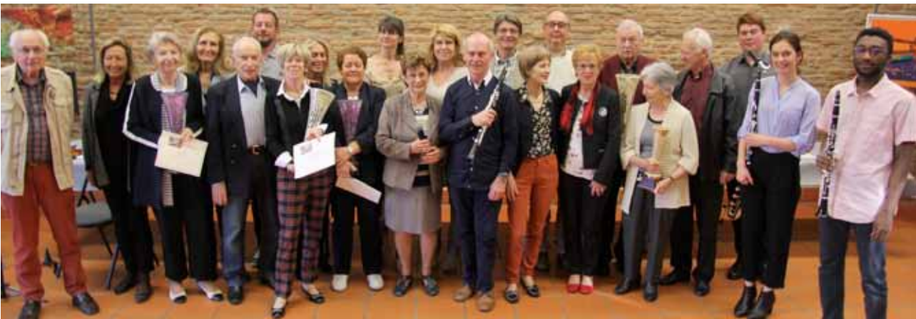
Remise des prix 2019.