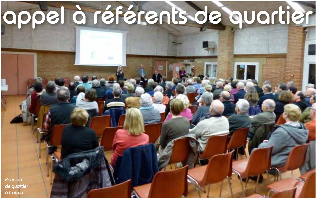
Réunion de quartier à Catala.

Fort du succès de cette démarche engagée dès 2014, la nouvelle équipe municipale lance un appel aux Saint-Orennais pour devenir Référents de quartier.